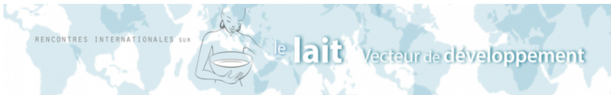
TABLE DES MATIERES